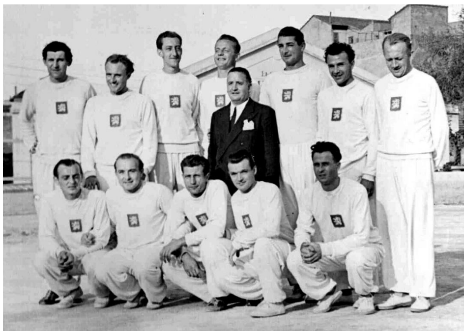
Obr. 2: Reprezentační výprava ve Francii

Na přelomu července a srpna roku 1947 se v Praze na Štvanici, v rámci I. Světového festivalu mládeže a studentstva, konal mezinárodní volejbalový turnaj mužů. Zde se poprvé ve finále utkal náš výběr s týmem Sovětského svazu a byl poražen. 125 Vzájemná, několik desetiletí trvající, rivalita tak započala. V srpnu téhož roku v Paříži 126 byly dále uspořádány první poválečné, v pořadí ale již IX. Světové akademické letní hry, kde náš výběr mužů získal titul akademických mistrů světa. 127 V říjnu roku 1947 se uskutečnily odvetné zápasy ve Francii (Obr. 2) a v Alžíru. A ještě téhož roku uskutečnily jednotlivé volejbalové kluby zahraniční výjezdy za účelem sehrání několika přátelských utkání. Jen AC Sparta vyjela za jeden rok do Polska, Nizozemska, Belgie a Rumunska. Sokol Kolín navštívil Bulharsko a Spolek tramských osad Benešovska (dále jen STOB) dokonce v Itálii. 128