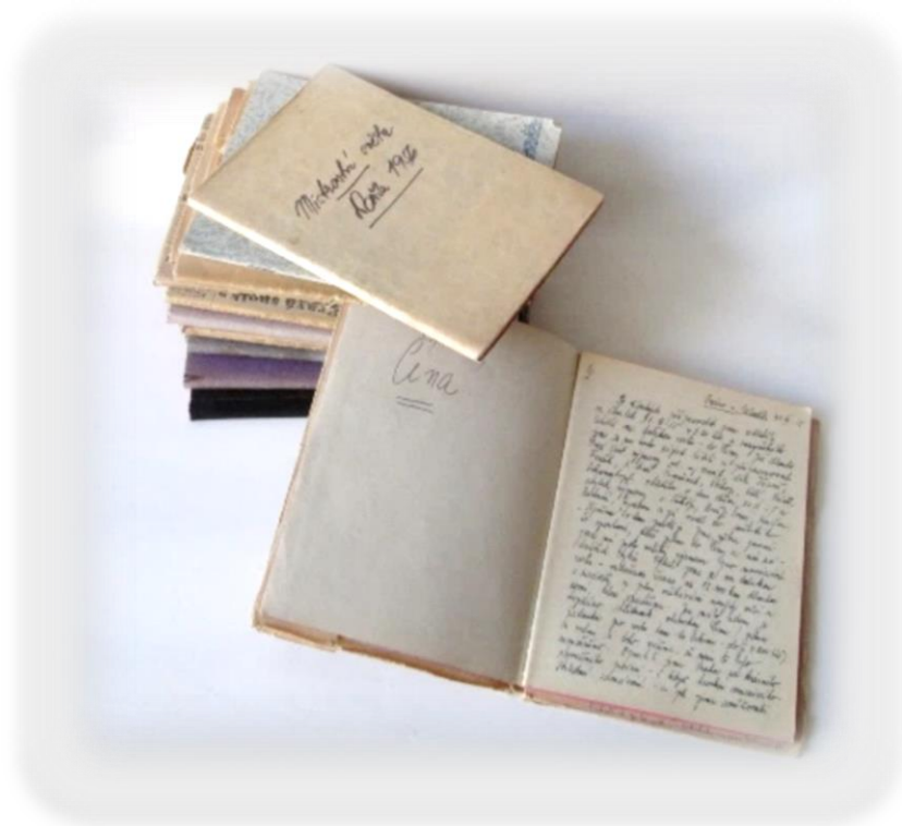
Obr. 1: Deníky Karla Pauluse