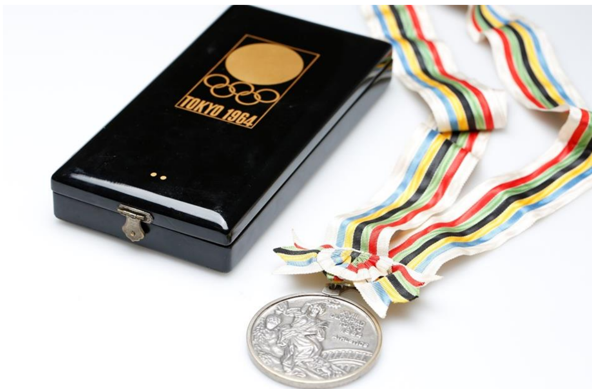
Obr. 4: Stříbrná medaile z OH 1964 v Tokiu (zdroj: ODTVS NM; H7H-36779)

si přál z olympiády zlato. Vždyť právě kvůli startu na olympijských hrách jsem pokračoval. A pak skončíte druhý jen horším poměrem setů. Není to k vzteku? 176