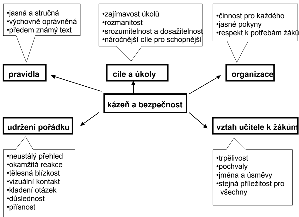
Obr. 81. Přehled hlavních faktorů ovlivňujících bezpečnost při školní tělesné výchově (Frömel & Ludva 1997)

Kázeň ve třídě závisí na mnoha faktorech, které může učitel ovlivňovat. Následující přehled některé z nich ukazuje.